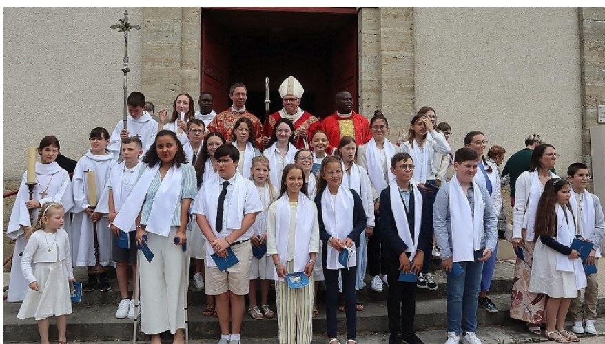
Les nouveaux confirmés du 16 juin à Fontaine-Française.

« Pour le chrétien, la cause missionnaire doit avoir la première place, car elle concerne le destin éternel des hommes et répond au dessein mystérieux et miséricordieux de Dieu. »