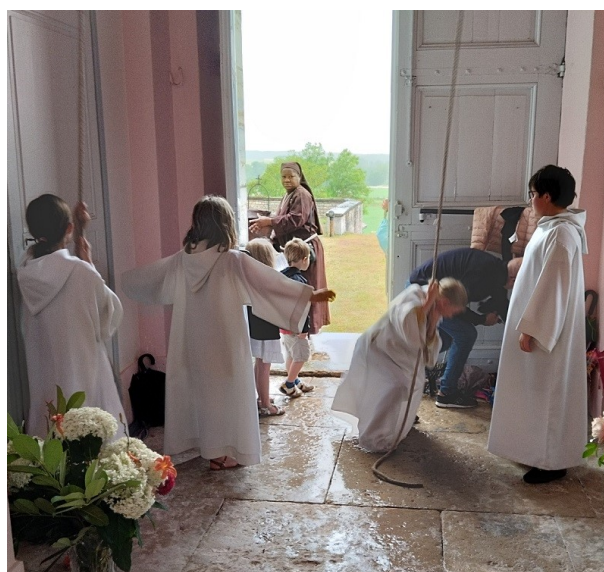
Ah, la sonnerie des cloches...!!

• Formation : « Se connaître sous le regard du Christ à partir de l'expérience de St Ignace de Loyola » : 8 jeudis matin de 9h à 12h à la Maison Diocésaine (10 octobre, 14 novembre, 12 décembre, 16 janvier, 20 février, 13 mars, 10 avril, et 22 mai). Objectifs de la formation : voir plus clair en soi, renouveler son regard sur sa vie et sa foi, mieux comprendre les personnes que l'on accompagne, ré-enraciner sa prière. Pour qui ? Pour ceux qui désirent faire le point sur eux-mêmes et sur leur relation à Dieu ; pour ceux qui désirent découvrir l'expérience d'Ignace de Loyola et la spiritualité ignatienne ; pour ceux qui désirent approfondir leur vie spirituelle et acquérir des « règles de discernement » ; pour ceux qui accompagnent des jeunes, des fiancés, des couples, des catéchumènes, des familles en deuil... Contenu : prière en commun, enseignement suivi d'un temps d'échanges, partage en groupe à partir d'écrits spirituels. Thèmes abordés : devenir qui nous sommes ; reconnaître ce qui se passe en nous ; relire sa vie pour y lire Dieu ; prier avec un texte biblique ; discerner, prendre une décision selon Dieu ; pardonner ; autorité et discernement ; jalousie, respect, louange. Contact : viespirituelle21@gmail.com ou 03.80.57.40.34 ou 09.79.29.86.38 (Père Paul Royet).